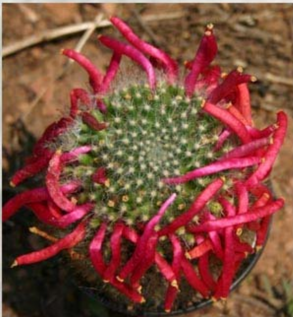
M. Brocassana con frutos.

El genero Mammillaria , perteneciente a la familia de las cactáceas fue ya descrito por Linneo en 1753 en su “ Species Plantarum ” como Cactus mammillaris y esto dio origen a su nombre actual, pudiéndose reconocer en su descripción a una especie, la Mammillaria mammillaris .