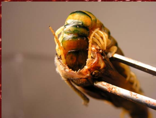
S.cingulata comiendo el interior de un saltamontes.

borde del tanque. Hacen gala de una enorme voracidad, y las especies más grandes llegan a comerse ratones adultos enteros. Son animales sobresalientes por no tener fondo a la hora de comer, comerán siempre que puedan y nunca rechazarán la comida (a excepción de los periodos de muda y durante la maternidad) por lo que hay que tener cuidado con el sobrepeso. La captura de sus presas acontece velozmente, las sujetan con sus patas delanteras y acto seguido les inoculan el veneno con los maxilípedos. Muchas veces, si la presa es grande, empieza a devorarla antes de que el veneno haya actuado totalmente. Son animales que al sentirse atacados tratan de huir, pero no dudarán en morder si se ven atrapados. Además, gozan de una increíble velocidad (son casi eléctricos en cuanto a movimientos y reacción), con lo que debemos andar con mucha atención a la hora de manipularlos.