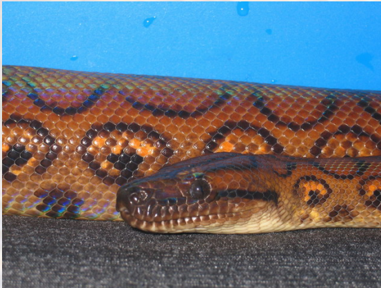
La iridiscencia es una característica propia de los ejemplares sanos.

La boa arcoiris ( Epicrates cenchria ), es un reptil fascinante, recomendado para aquellos aficionados a la herpetología que ya tengan cierta experiencia y deseen mantener una boa de talla mediana, elegante y de vivos colores.