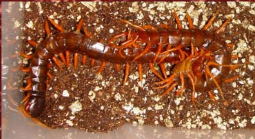
S. spinosissima iniciando el apareamiento.

abertura genital. Llegados a este punto, las relaciones entre los dos volverán a ser ariscas, existiendo incluso el riesgo de que el macho pase a ser el primer almuerzo de la futura mamá Scolopendra.