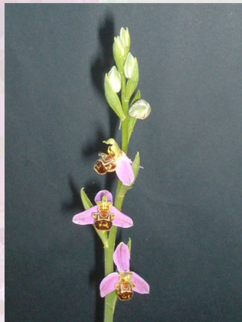
Ophrys apifera .

Hasta aquí hemos dado un buen paseo, pero pronto nos encontraremos y continuaremos aprendiendo más cosas de las orquídeas.