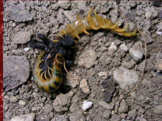
Detalles anatómicos de una S.cingulata devorando carroña, en este caso una araña no identificada.

Una vez visto el cuerpo, no entraremos a detallar las partes de las patas, ya que resulta innecesario. Tan sólo decir que encontraremos un par de patas en cada metámera (en milpiés encontraremos siempre dos pares de patas por segmento) excepto en la primera metámera, que es justo donde encontramos los maxilípedos. Cada escolopendra tiene de 20 a 22 metámeras, por tanto el doble de patas, y por tanto, el concepto de ciempiés no es totalmente acertado para estos animales. También son una excepción las patas terminales. Estas siempre están orientadas hacia atrás en vez de hacia los lados, y normalmente son mas grandes y largas que las otras. Contrariamente a lo que mucha gente cree, estas patas no tienen ni las estructuras ni la capacidad de inocular veneno, pero cuando están erguidas tienen la función de avisar al depredador de que está molestando a un animal potencialmente peligroso. En las hembras, estos apéndices tienen una función extra; acoger la puesta, ya que es común que ésta se enrolle sobre sus huevos.