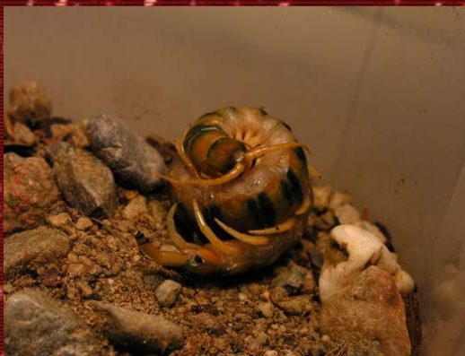
S. cingulata protegiendo sus huevos.

Entre el encuentro sexual y la puesta, la hembra debe ser alimentada el doble de lo habitual y al cabo de unas 6 semanas después del apareamiento, esta pondrá desde 20 hasta 95 huevos de color amarillento y de tacto gelatinoso. Los huevos serán protegidos por el cuerpo de la madre, la cual formará una especie de abrigo entorno a ellos. Desde el período de la puesta hasta que las crías abandonen los cuidados maternos, debemos mantener la humedad elevada, no debemos darle de comer y lo más importante de todo, no podemos hacer ruido ni producir vibraciones (como las de una obra, o trasladar el terrario) y no podemos dejar que les de la luz. Hay que tener mucho cuidado de no perturbar la tranquilidad de la madre cuando tiene crías, ya que esto solo puede provocar que estas sean devoradas (esto representa el 95% de los fracasos en la reproducción y es extremadamente fácil que acontezca sin aparente motivo. No se culpe a si mismo si esto le sucede). No hay que olvidar proporcionarle una buena humedad relativa.