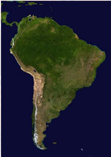
Ortofoto de Sudamérica.

De forma general, se conocen la mayoría de los aspectos relacionados a esta especie, aunque aún hoy se descubren nuevas características de esta; los últimos avances tecnológicos permiten diferenciar las subespecies en función del análisis de la secuencia de ADN, lo que por ejemplo ha repercutido en su clasificación. También se ha profundizado en los conocimientos acerca de su biología y etiología.