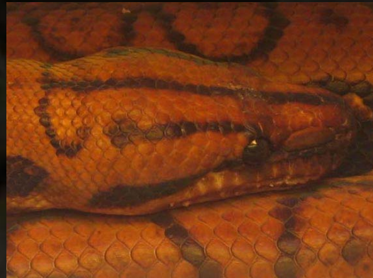
Ejemplar de boa arcoiris