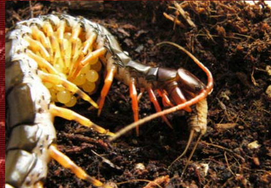
S. subspinipes chinese stripped legged con huevos, y comiendo un grillo (una acción bastante desaconsejable).

Tres semanas después de la puesta, los huevos eclosionarán y las protoninfas saldrán a la superficie. Son de color blanquecino y aun no tienen la capacidad de andar ni de comer. Ahora la madre se tumbará con los terguitas en contacto con el suelo y con las esternitas mirando hacia arriba, con todas las crías sobre ella. Tres semanas más tarde estas protoninfas evolucionarán a ninfas al cambiar su piel, estas ya están coloreadas y andan. Poco después de la muda de protoninfa a ninfa, las crías se hacen ya independientes y podemos separarlas de su madre. Comerán por si solas y debemos ofrecerles las condiciones descritas anteriormente para juveniles. Podemos mantener a las ninfas unidas en pequeños grupos hasta la siguiente muda, que es cuando ya pueden darse casos de canibalismo entre lo que en esta fase se denominan ya 'pedelings (del termino inglés centipedelings). Hay que tener cuidado porque la voracidad de estos animales, ya desde pequeños, es tal que si no nos damos prisa en separar las ninfas de la madre cuando estas ya andan, la madre puede pasar a ser el primer banquete de sus propios hijos.