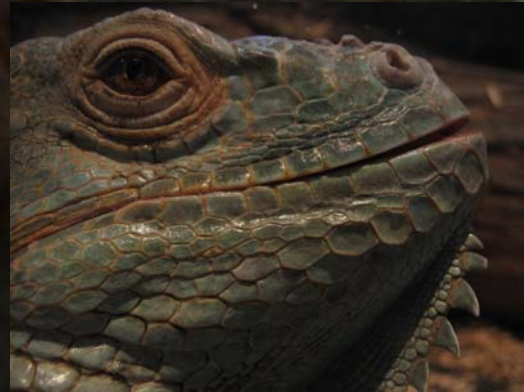
Juancho, Fot. Exotarium.

Una vez el ejemplar llega al centro, se le realiza una revisión completa y se mantiene un periodo de cuarentena hasta que se le pasa a una instalación definitiva.