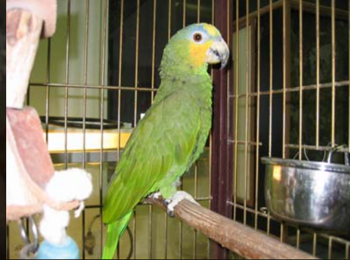
Bruno, el amazonas.

estaban siendo devorados, entonces los atraparon y nos los trajeron.