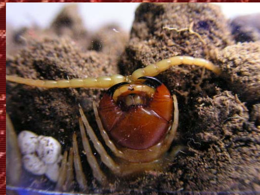
Detalle del aparato bucal de Scolopendra cingulata .

A simple vista, podemos distinguir dos partes: cabeza y cuerpo. La cabeza (o plato cefálico) es la parte más evolucionada de estos invertebrados. En ella hallamos 4 pares de ocelos segmentados adaptados para la visión nocturna, dos antenas que le proporcionan el sentido del tacto y del olfato, y un aparato bucal bastante complejo. Este se compone a su vez de primera maxila (semejante a dos muelas dispuestas a los laterales de la línea media de la boca), estas son las que se encargan de triturar los pedacitos de la presa antes de ingerirlos. La otra parte; la segunda maxila, es más móvil y larga, sirve para situar el alimento en la entrada de la boca. Pero sin duda la parte más atrayente de esta región, son los maxilípedos. Estas estructuras antaño fueron patas, pero con el paso del tiempo evolucionaron hacia unas glándulas venenosas, terminadas en una punta dura y aguda (hiperquitinada), con un canal semejante al de las agujas hipodérmicas, y con una fuerza suficiente como para traspasar las pieles de presas y enemigos.