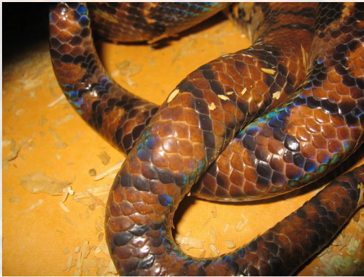
Si todo va bien, el aficionado tendrá oportunidad de observar cópulas como la que se muestra en la foto.