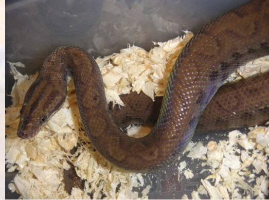
Ejemplar nacido en cautividad de boa arcoiris colombiana ( E. C. maurus ).

De cría, se asemeja bastante a la subespecie cenchria, aunque la subespecie maurus suele ser de colores más oscuros, y no tiene los anillos tan bien contrastados como la cenchria. Conforme va alcanzando la madurez va adquiriendo un color uniforme que puede variar entre el marrón claro o crema, homogenizándose este color por todo el cuerpo. Los anillos oscuros van difuminándose hasta prácticamente desaparecer, sobre todo en la región dorsal del reptil.