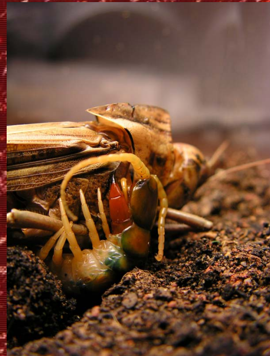
S. cingulata devorando un saltamontes.

Se debe poner, en el terrario de especies de la pluviselva, un platito con agua, las especies desérticas beberán del agua que pulvericemos sobre el cristal una vez por semana.