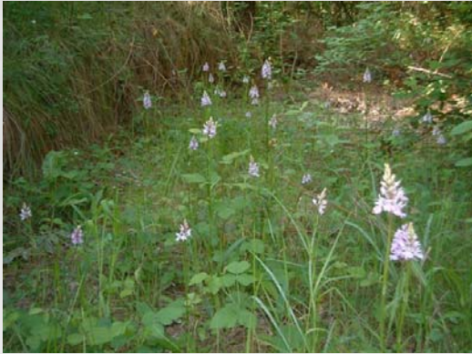
Grupo de Anacamptis sp.