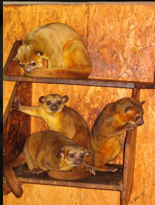
Cirilo y compañía.

Esta claro que lo ideal sería que cada animal viviese en su hábitat, pero como en la sociedad actual en la que vivimos esto es imposible, nuestro objetivo es que las personas sean conscientes del animal que están adquiriendo. Que cuando lo comprendan sepan que un guacamayo es un animal social que puede vivir hasta 70 años, que las chinchillas lavan su pelo con cenizas volcánicas o que un macho de iguana adulta necesita varios kilómetros cuadrados de territorio. Simplemente pretendemos concienciar que un animal es una vida y no el juguete del niño y que cuando nos cansamos lo tiramos.