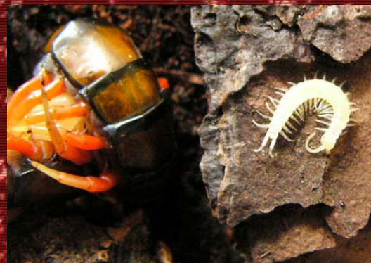
S. subspinipes malasyan con sus protoninfas.

Tres semanas después de la puesta, los huevos eclosionarán y las protoninfas saldrán a la superficie. Son de color blanquecino y aun no tienen la capacidad de andar ni de comer. Ahora la madre se tumbará con los terguitas en contacto con el suelo y con las esternitas mirando hacia arriba, con todas las crías sobre ella. Tres semanas más tarde estas protoninfas evolucionarán a ninfas al cambiar su piel, estas ya están coloreadas y andan. Poco después de la muda de protoninfa a ninfa, las crías se hacen ya independientes y podemos separarlas de su madre. Comerán por si solas y debemos ofrecerles las condiciones descritas anteriormente para juveniles. Podemos mantener a las ninfas unidas en pequeños grupos hasta la siguiente muda, que es cuando ya pueden darse casos de canibalismo entre lo que en esta fase se denominan ya 'pedelings (del termino inglés centipedelings). Hay que tener cuidado porque la voracidad de estos animales, ya desde pequeños, es tal que si no nos damos prisa en separar las ninfas de la madre cuando estas ya andan, la madre puede pasar a ser el primer banquete de sus propios hijos.