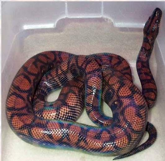
Ejemplar adulto de boa arcoiris de Isla Marajo ( Epicrates cenchria barbouri ).

Es otra subespecie rara de ver en las colecciones privadas, aunque en los últimos años el número de ejemplares mantenidos en cautividad va creciendo paulatinamente.