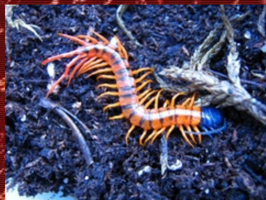
Scolopendra sp. de origen desconocido.

El genero Scolopendra cuenta actualmente con 170 especies, subespecies y variedades descritas, pero desgraciadamente y como viene siendo común en artrópodos, la clasificación taxonómica es sumamente difícil. Y si a esto le sumamos la escasez de estudios realizados, nos encontraremos con un sinnúmero de especies sin clasificar (con el daño que esto puede conllevar para el individuo a mantener). Estas especies sin clasificar son las que llevan escrito el sufijo sp. detrás del género. No en vano, es usual encontrar que las especies sin taxón suelen llevar escrita la procedencia detrás del clásico sp. y esto ya es ayuda suficiente para hacerse una idea de cómo acondicionar el terrario. Es importantísimo saber que animal vamos a adquirir para darle un buen mantenimiento; así, el ejemplar en cuestión vivirá con nosotros muchos años y sin problemas de salud. Además las diferentes variedades geográficas existentes, tienen una coloración muy diversa, que no ayuda en nada a su identificación (el ejemplo más llamativo es el de la S.subspinipes que abarca coloraciones, desde totalmente negra hasta rojos intensos, pasando por franjeados de varios colores).