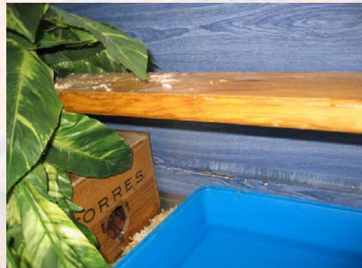
Terrario típico donde el autor aloja una pareja de boas arcoiris ( E. cenchria ).

Respecto al sustrato utilizado, existen multitud de opciones: viruta para animales, fibra de coco, papel de cocina ó papel de periódico, etc. La mayoría de estas opciones son válidas, aunque hemos de excluir algunos materiales como el serrín, el cual provocaría problemas respiratorios; la arena y tierra tampoco son recomendables, pues puede ser ingerida durante la ingesta de alimento y causar problemas digestivos. En época de apareamiento, si se pretende la reproducción, tampoco es aconsejable el uso como sustrato del césped artificial, pues puede resultar abrasivo para los hemipenes u órganos copuladores del macho (Com. Pers).