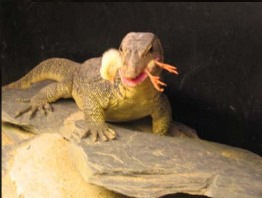
Hembra de varano acuático.

criadores particulares suelen empezar en este mundo con mucha ilusión y porque les encanta y no con un fin lucrativo, por esto suelen ser los que mejor tienen a sus animales y los que más saben acerca de ellos. De hecho, hay muchos que han conseguido criar especies en cautividad que nunca antes se habían conseguido. Me parece, por tanto, que tenemos que distinguir entre el criador profesional y la familia que tiene una iguana en casa para que juegue con el niño. Son perfiles completamente diferentes. De hecho, intentamos preparar una reunión de centros de rescate, comerciantes, criadores particulares, CITES,... etc, con el fin de hablar un poco sobre este tema que, al fin y al cabo, nos afecta a todos.