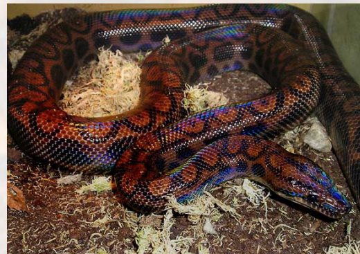
Ejemplar adulto de arcoiris, subespecie peruana ( Epicrates cenchria gaigei ). Foto: Craig McSherry.

La boa arcoiris peruviana posee ocelos en la línea dorsal y en ambos costados del cuerpo, y con frecuencia presenta colores más claros en el interior de éstos ocelos.