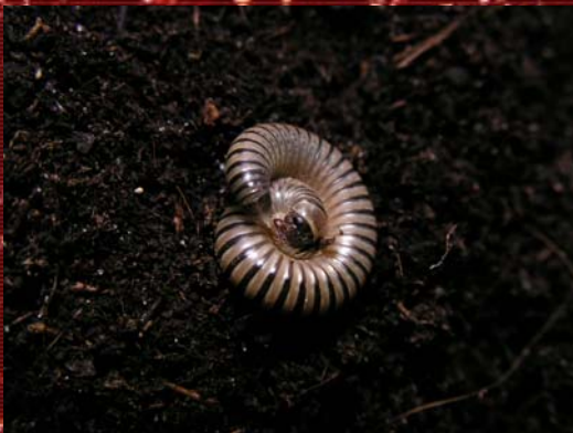
Compárese este milpiés con el ciempiés de la foto anterior.

Para saber algo más sobre la historia natural del género, debemos remontarnos a hace 540 millones de años, y situarnos en los mares, donde poco después de la creación de los protozoicosforos (actuales peripatos) aparecen los primeros myriapodos (sinónimo de chilopoda; engloba los ciempiés; chilopoda , y milpiés; diplopoda entre otros). A partir de aquí, y después de abandonar el mar, la línea evolutiva dio todo el abanico de especies que conocemos hoy en día, entre los cuales encontramos este magnífico grupo de animales que estamos describiendo.