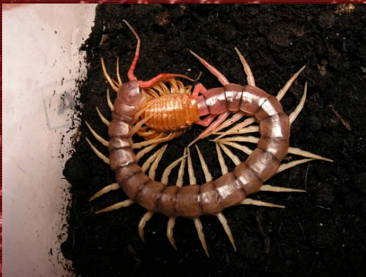
S. subspinipes de Hanni Mau Chau mudando.

La muda se anuncia cuando el animal deja de comer, este período puede tardar desde tres días hasta dos semanas, dependiendo de la edad del ciempiés. Durante el proceso se dejará al animal tranquilo, sin darle de comer y con una humedad elevada. Scolopendra sp. sale de su anterior coraza por donde tiene la cabeza, y se desliza hasta que sale todo el cuerpo. A continuación, el animal se encuentra blando y débil por el gran gasto de energía empleado. Para recuperar dicha energía, estos miriápodos suelen comerse su propia exuvia.