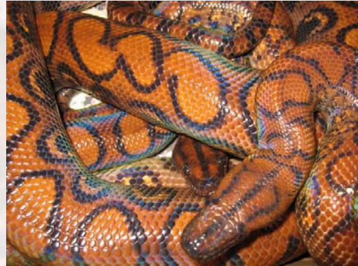
Ejemplares de boa arcoiris.

A partir de las escamas supraoculares surge otra línea de color negro, la cual también acaba al final de la región cefálica.