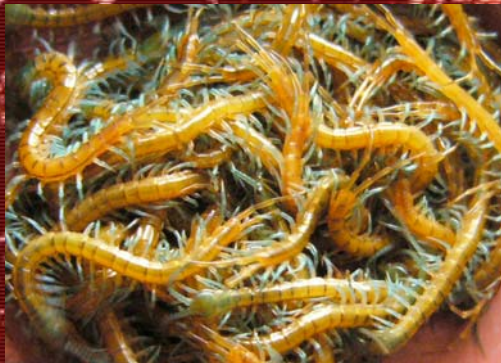
Pedeling de S. subspinipes chiseni stripped legs .

Las especies tropicales se reproducirán todo el año sin importar la fecha, pero las subtropicales solo lo harán después del período de hibernada. No esta de más decir que las hembras pueden guardar esperma para fertilizar incluso 3 puestas de huevos, aconteciendo incluso entre puesta y puesta una muda. Se han dado también casos de partenogénesis; esto viene a decir que la madre produce crías sin necesidad de acoplamiento con un macho, en este caso todas las crías son de carga genética idéntica a la madre, todas hembras y copias perfectas de esta.