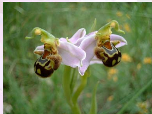
Ophrys apifera con malformaciones.