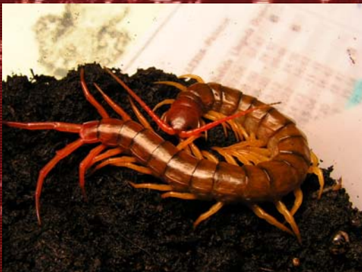
S. subspinipes de hannii Mau Chau .

- S. subspinipes (con dos subespecies, la nominal y de Hanni, además de una cantidad inmensa de variedades siempre acompañadas del nombre de su procedencia (la cual varía desde Malasia o Vietnam hasta el continente Sudamericano). Su tamaño es realmente considerable, siendo la segunda más grande con unos 28 cm de media detrás de la S. gigantea . Es de carácter tropical y posee el veneno más potente de todo el género (en especial la variedad vietnamita Mau Chau).