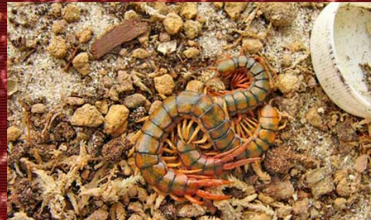
Diferenciación sexual en una Scolopendra sp.

La diferenciación de sexos es externamente inapreciable para el neófito. En algunas especies existe dimorfismo sexual en las patas terminales, siendo en el macho más largas y esbeltas que en la hembra, aunque si no hay dos ejemplares para comparar, difícilmente se hallará la diferencia. Si no apreciamos diferencias en las patas terminales de la especie en cuestión, solo nos quedará probar al azar con el riesgo que eso entraña.