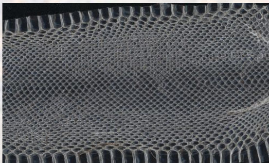
Muda de boa arcoiris ( E. cenchria ).

Algo parecido pasa con los ocelos laterales, aunque en este caso pueden presentar tonos más claros (crema, salmón) en su interior, rodeando un "ojo" central de color negro u oscuro, lo que contribuye a darle gran belleza a esta boa.