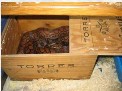
Un buen refugio constituye un importante aporte al bienestar de los reptiles.

El fotoperiodo debe ser normalmente de 12 horas de luz y 12 de sombra, pudiendo variar en función de la estación del año. Si las serpientes disfrutan de luz natural, el mismo ciclo circadiano de luminosidad y oscuridad es suficiente; sino es así, será el propio herpetólogo el que vaya variando el fotoperiodo al que las boas son sometidas. En este caso, es recomendable el uso de un programador diario, el cual se puede conseguir por poco dinero en tiendas de bricolaje y ferreterías.