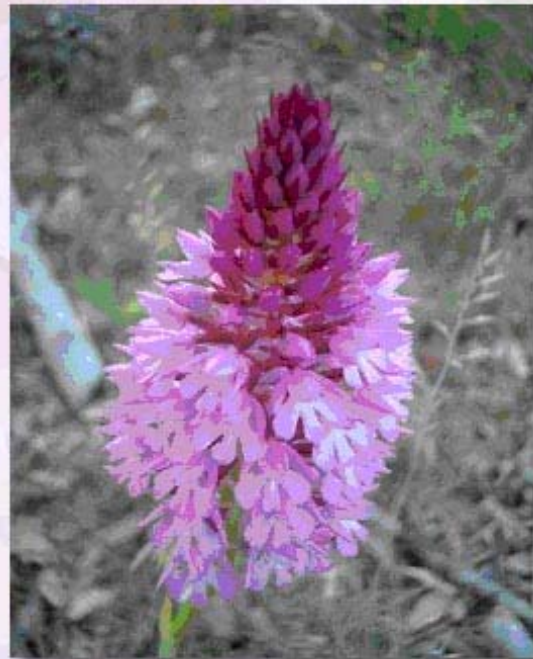
Anacamptis pyramidalis .

Puede medir entre veinte y cuarenta centímetros. Las hojas son verde claro, estrechas y largas.