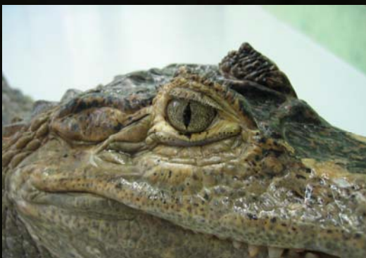
Ejemplar de caimán.

Tenemos muchos reptiles como iguanas, boas, pitones, algunas venenosas, gecos, varanos, tejues, tarántulas, escorpiones, mapaches, coaties, mofetas, perritos de las praderas, chinchillas, hurones, guacamayos, cacatúas, tortugas, etc. Al fin y al cabo nosotros no diseñamos la colección sino que es el propio destino el que nos va diciendo que animales estarán con nosotros, pero nunca presumiremos de tener esta especie rarísima que nadie tiene, todo lo contrario, animales “comunes” de los que vemos en los comercios porque son los que nos llegan. Además, no suelen ser los ejemplares más bonitos, sino que muchos llegan con graves problemas de salud (descalcificaciones, deformidades, amputaciones, quemaduras,...etc), es una realidad que queremos mostrar para que los visitantes vean lo que pasa ante un mal cuidado o desinformación.