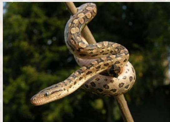
Todas las boas arcoiris son buenas trepadoras, como muestra este ejemplar de boa arcoiris argentina ( Epicrates cenchria alvarezii ).

La boa arcoiris argentina muestra colores oscuros de fondo (marrón o naranja oscuro), y en los costados a veces se observan colores más claros (crema, marrón claro). En la zona dorsal, el color de fondo puede verse limitado alrededor de los ocelos, los cuales se alternan y unen a veces; también es remarcable la marcada diferencia de color del interior de los ocelos dorsales, con un color naranja tostado muy vistoso. Los ocelos laterales suelen quedar reducidos a grandes lunares negros, con una zona más clara en la parte superior al ocelo.