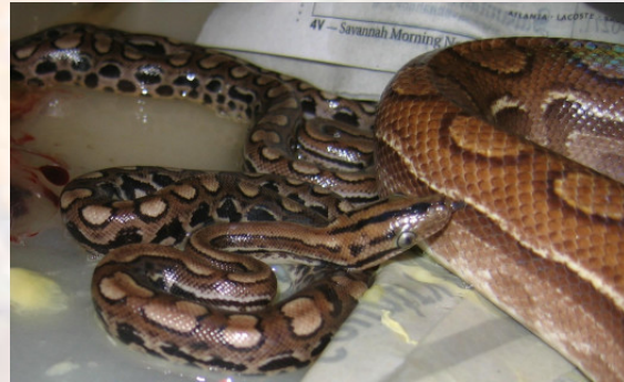
Especímenes recién nacidos de boa arcoiris de Campiña Grande ( Epicrates cenchria assisi ).

Desafortunadamente, no se ven ejemplares en colecciones privadas con frecuencia, y no parece que haya planes a corto plazo de que el número de estos disponibles vaya a aumentar de forma notable. Existen muy pocos criadores que tengan ejemplares de esta subespecie, y fundamentalmente se localizan en el continente americano, aunque de forma puntual también se ven ejemplares en venta en el viejo continente.