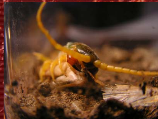
Detalle de los maxilípedos de una S.cingulata .

Por tanto concluimos que una picadura producida por el género Scolopendra es algo de lo que no debemos preocuparnos, pero sí, de lo que debemos ocuparnos.