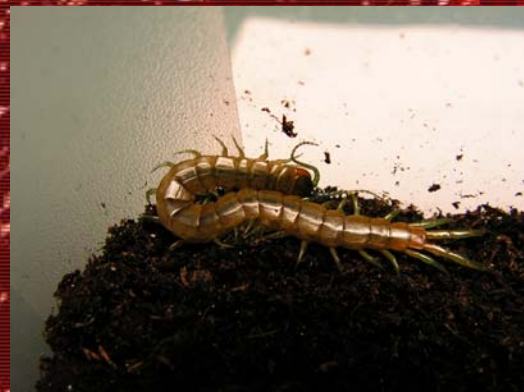
S. canidens canidens .

No está de más decir que en España podemos encontrar dos especies del género Scolopendra; la anteriormente nombrada S. cingulata y la S. canidens con la subespecie nominal y la subespecie onanensis ; más clara que la anterior.