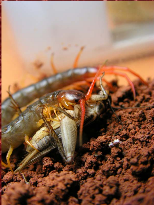
S. subspinipes Dehanni Mau Chau juvenil.

muy posiblemente jugando con el animal tras su hallazgo en la selva. El segundo caso fue el de un militar que recibió dos mordeduras en la cabeza (justo la zona más irrigada del cuerpo) durante la guerra del Vietnam. Esta es la especie que más veneno inyecta por su mordedura.