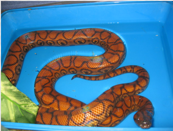
Les encanta pasar las horas tomando un baño.

Recordemos que los reptiles son vertebrados ectotérmicos, es decir, no producen el calor necesario para realizar su actividad metabólica óptima, por lo que deben tomar esa energía del medio exterior, y es por lo que durante el día suelen asolarse en una buena rama, o en una piedra que se haya calentado por efecto del Sol.