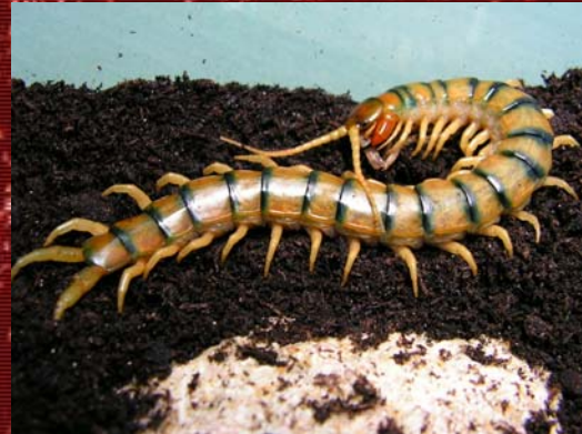
S. cingulata egypt .

su recogida de la naturaleza. Mide de 10 a 14 cm y su coloración es amarilla pálida con un bandeado negro en las uniones de los tergos.