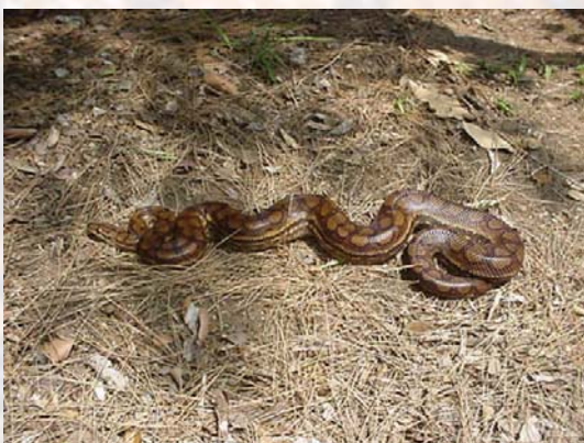
Ejemplar adulto de boa arcoiris de Guyana ( Epicrates cenchria crassus ).

Esta subespecie proviene de la región de Guyana (Paraguay), por lo que también recibe el nombre de boa arcoiris de Paraguay. Se trata de una subespecie que hasta hace pocos años era rara de ver mantenida en cautividad, aunque en la década de los 80 empezaron a importarse a criadores norteamericanos, y actualmente están incluidas en los programas de cría de algunos criadores americanos y en menor número en los europeos.