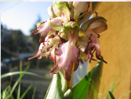
Himantoglossum robertianum . Fot. de S. Navarro.

También podemos encontrar la orquídea europea de más tamaño, la Himantoglossum robertianum , fácil de localizar ya que puede medir 60 centímetros o más. Las hojas crecen en roseta, son verdes y brillantes y de allí nace un tallo robusto, de color rojizo. La inflorescencia está formada por un número elevado de flores, que pueden ser veinte o veinticinco, de color rosa y con los bordes púrpura. Son perfumadas con una fragancia suave. El labelo tiene el borde ondulado y es mucho más grande que los otros pétalos, como se puede apreciar en la fotografía. Enterrados, tiene dos hermosos tubérculos con forma de huevo.