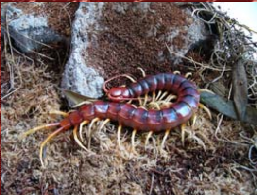
S. gigantea robusta adulta.

- S. gigantea (L. 1758) con sus dos variedades (que no subespecies); la nominal y la robusta. Procedente de Sudamérica. Con una coloración anaranjada, y de una longitud desde la cabeza a las patas terminales de 26-30 cm (incluso más). Es un animal de carácter tropical y realmente muy activo y voraz.