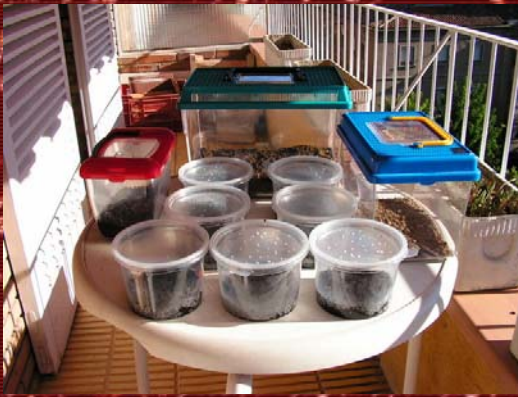
Ejemplo de terrarios para scolopendra de diferentes tamaños.