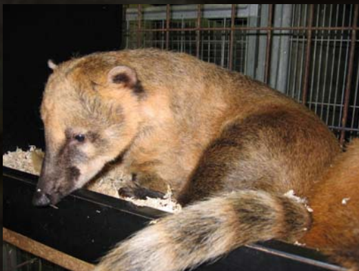
Coatíes